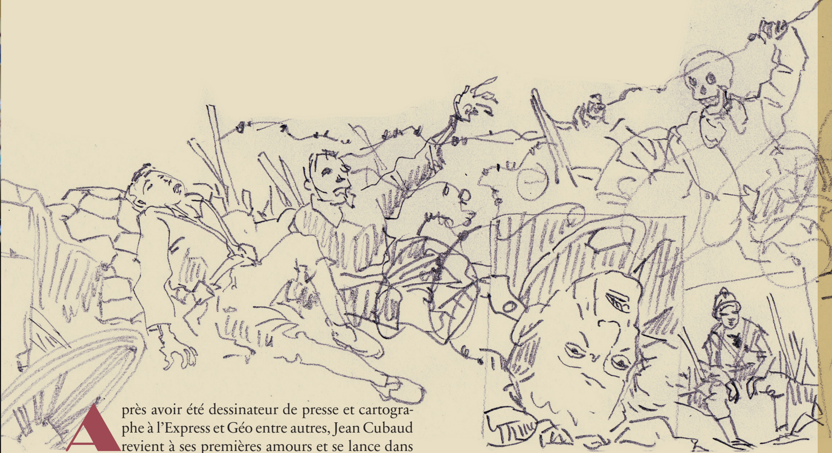
2010, dessin préparatoire à La cavalière Elsa.