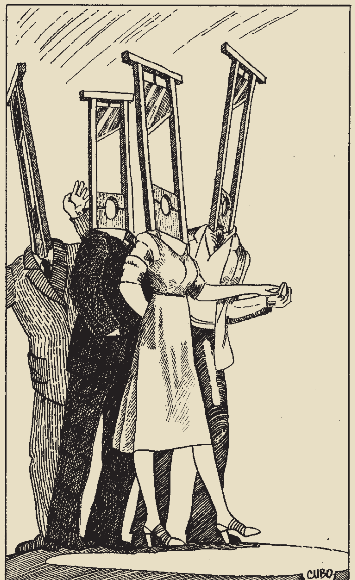
1976, dessin de presse.