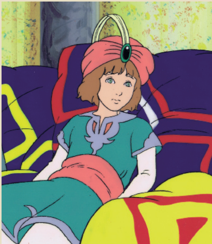
1986, Clémentine, série du même nom, pour France-3.

Auteur de plusieurs films d'animation pour la télévision, il adapte et réalise, pour le cinéma, La Légende de Parva, en collaboration avec Vincenzo Cerami, écrivain et dramaturge italien.